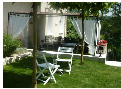
Espace de repos entouré de verdure, surplombant la rivière.