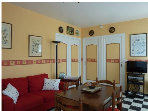
Cuisine, salon/salle à manger très lumi- neux. Ecran plat, Internet. Vue sur la piscine et le Dropt.