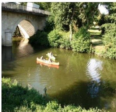
Berge privée accessible pour la pêche et les kayaks.

Au cœur du Bergeracois, notre gîte récemment rénové vous accueille en pleine nature, dans la magnifique bastide d'Eymet.