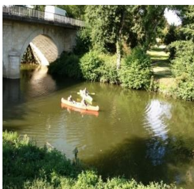
Berge privée accessible pour la pêche et les kayaks.

Au cœur du Bergeracois, notre gîte climatisé récemment rénové vous accueille en pleine nature, dans la magnifique bastide d'Eymet.