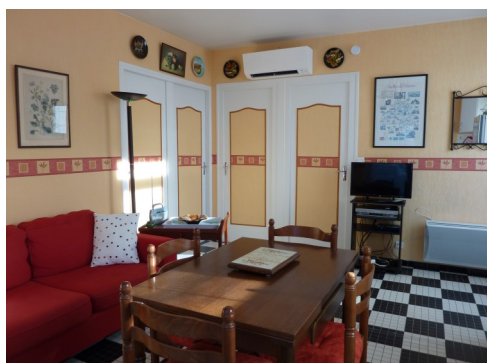
Cuisine, salon/salle à manger très lumineux. Télévision, Internet. Vue sur la piscine et le Dropt.