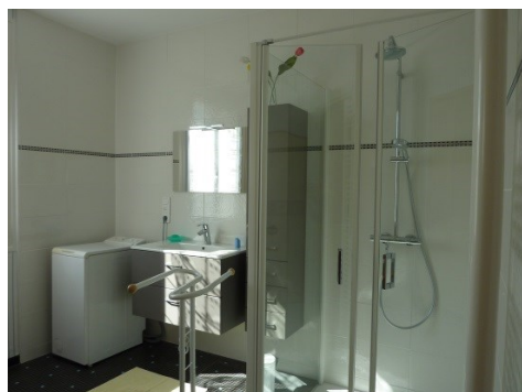
Salle de bain : Douche à l'italienne, lave-linge, meubles, lavabo. Vue sur la rivière et la piscine.