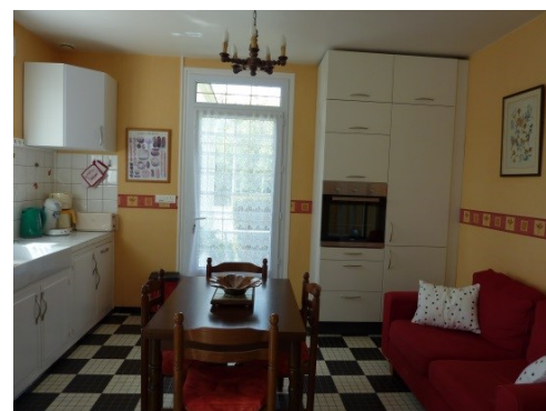
Cuisine, salon/salle à manger entièrement équipée : lave-vaisselle, four, micro-ondes, cafetière.