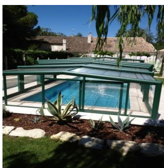
Grande piscine privée, d'eau salée, avec abri amovible permet de se relaxer et de se rafraîchir sur différents niveaux de profondeur.