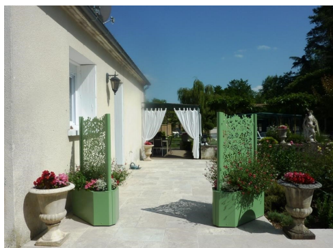
Grande terrasse, jardin clôturé et très bien entretenu